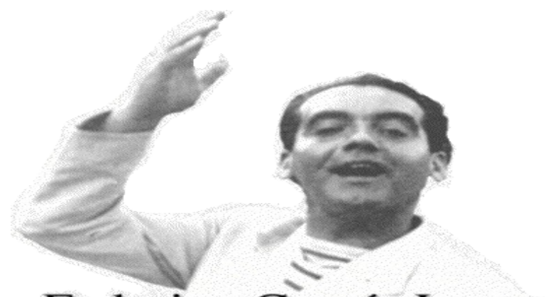
Federico García Lorca