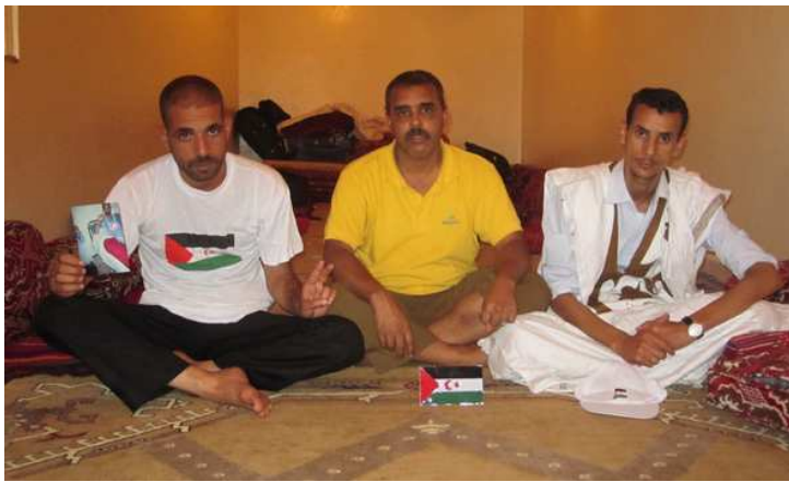
CSPRON v AFAPREDESA