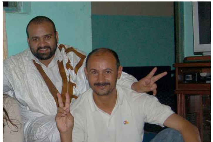
CODESA - Tantan