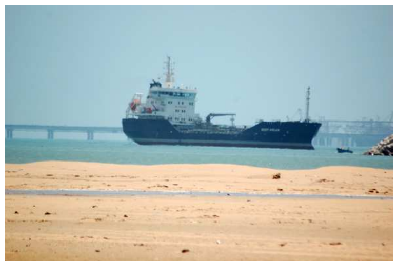
Barco pesca en Puerto del Aaiún