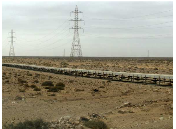
Cinta transportadora de fosfatos a las afueras del Aaiún, camino a Boiador.