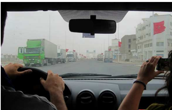
Avda. Puerto del Aaiún con camiones blancos que exportan la pesca expoliada