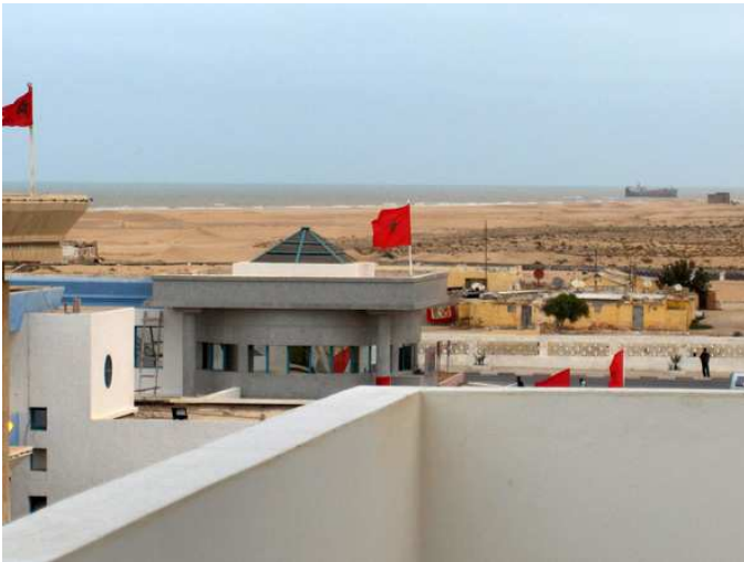
Puesto de control del Puerto del Aaiún