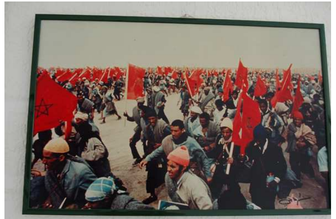
Escenas Marcha Verde expuestas en el Parador Nacional