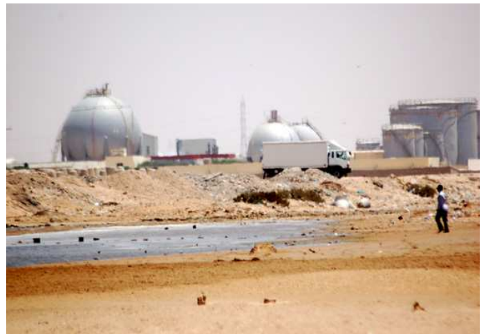
Fábricas del Puerto del Aaiún