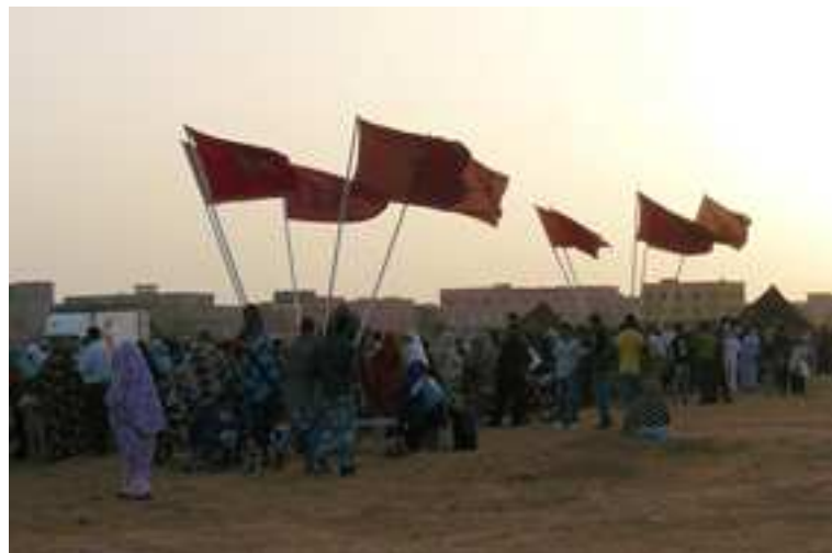
Fiesta Popular en Guelmin.