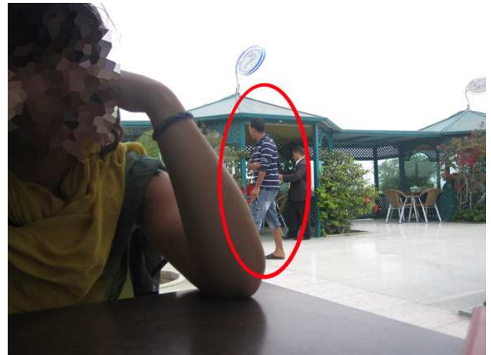
Los españoles son seguidos de cerca por policías de paisano en Dajla.