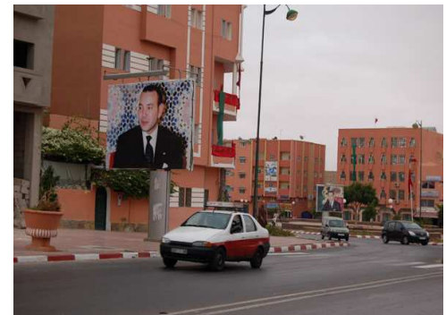
Vallas publicitarias con la imagen de Mohamed VI repartidas en diferentes lugares del Aaiún