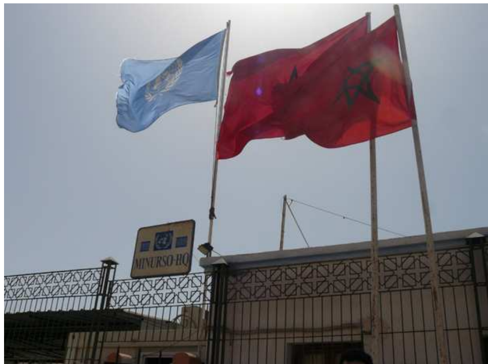
Entrada de la Minurso