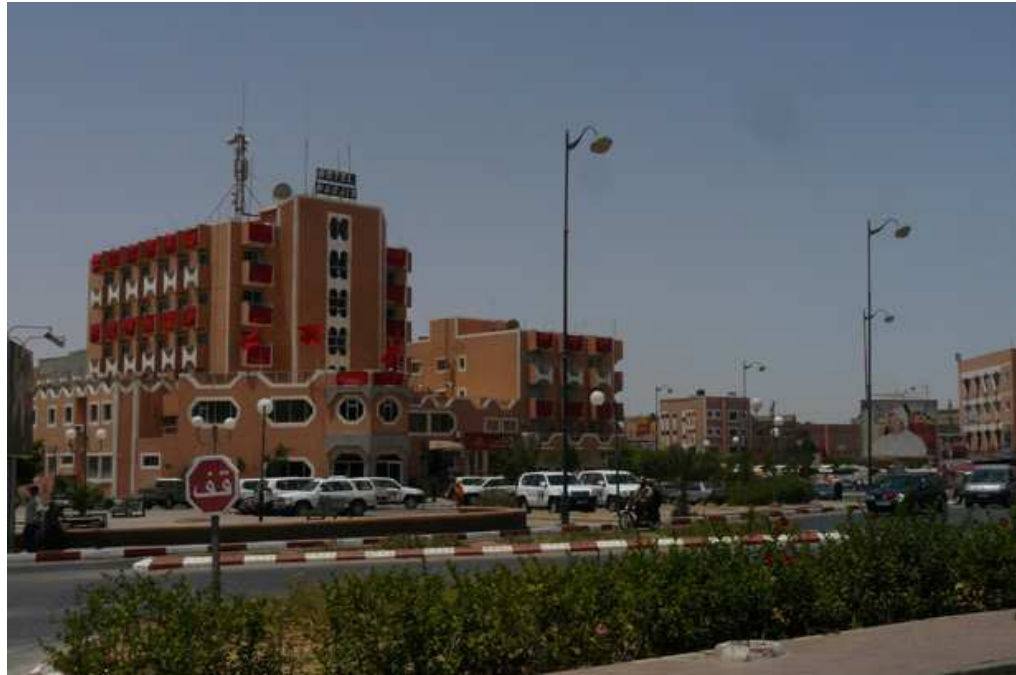
Hotel Nagjir, donde se aloja la MINURSO