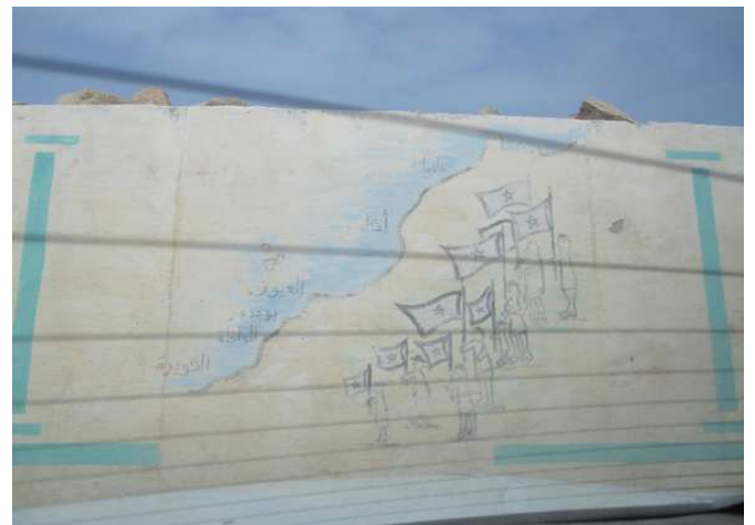
Colegios del Aaiún y Bojador con representaciones de la Marcha Verde