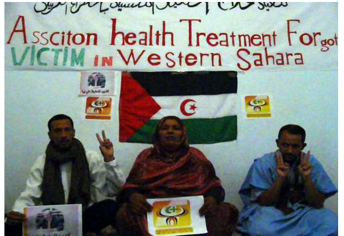
Asoc. Asistencia Médica a las Víctimas Olvidadas S.O.