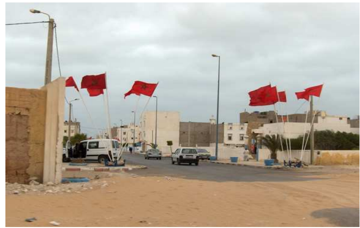
Entrada puerto del Aaiún y Playa