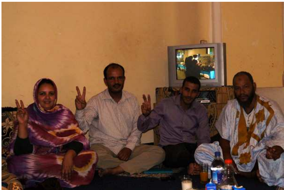
Comité por la Preservación de la Memoria Saharaui

El grupo de Thawra, no solo nos hemos reunido con diferentes asociaciones del Sáhara Occidental ocupado, sino que también hemos tenido la oportunidad de recoger testimonios de diferentes personas, que a nivel individual, han querido contarnos su experiencia personal, demandándonos expresamente hacerla pública.