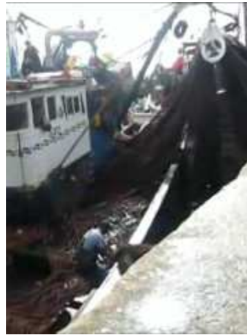
Puerto de Dajla. Pesca con redes de arrastre.