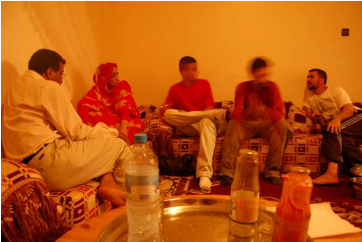
CODESA - Aaiún