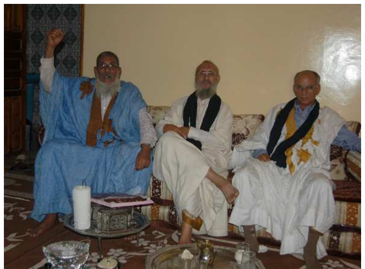
Extrabajadores de FosBucraa