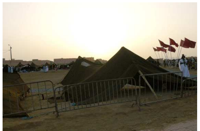
Fiesta de Guelmin donde se muestra la apropiación marroquí de la cultura saharai