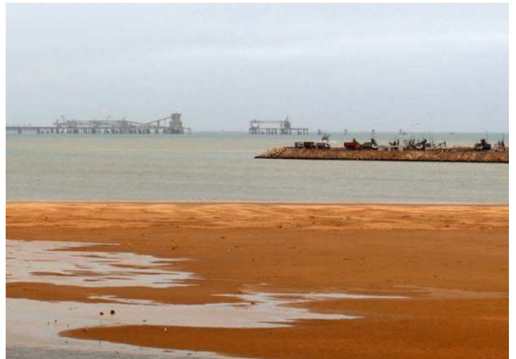
Cinta transportadora de fosfatos en el Puerto del Aaiún