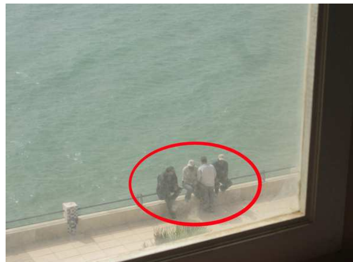
Más momentos del seguimiento en Dajla