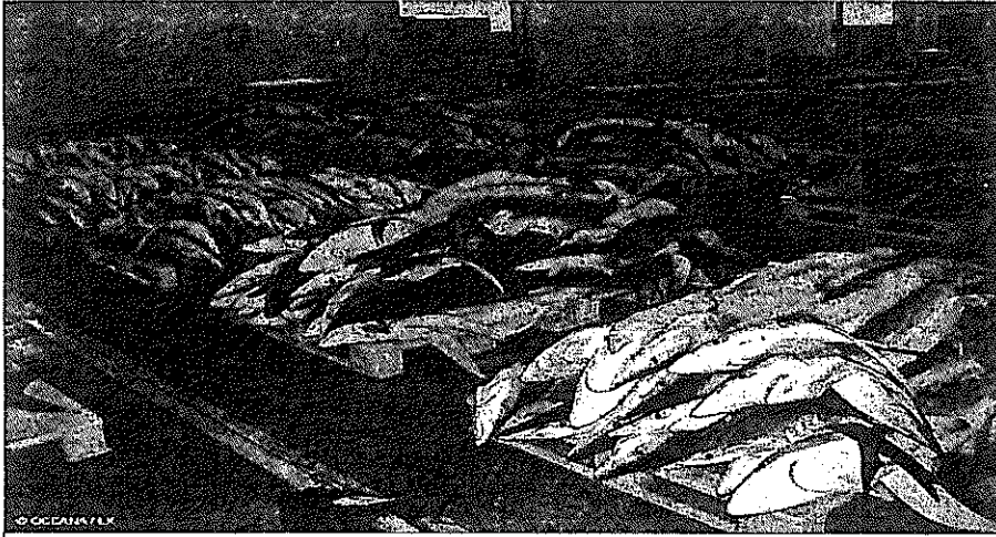
Una Lonja repleta de Tiburones capturados en Almería

La extinción de estos animales tiene grandes repercusiones en la naturaleza y el medioambiente, pero en el caso de estos animales -que tienen más historia que los propios dinosaurios - puede provocar una catástrofe brutal en el entorno, sobre todo por el papel fundamental que juegan los tiburones por su condición de depredadores: limpian el mar.