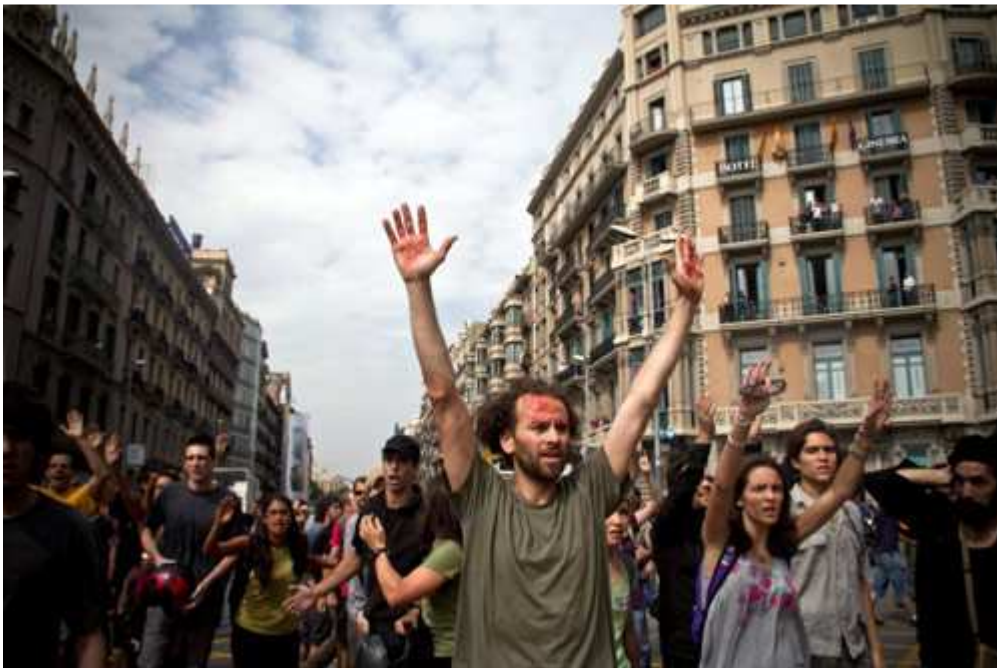
Barcelona, 27 de mayo

antimilitarista. En vez de esto, ha sido creado a partir del propio contexto democrático; la base estaba preparada, en mi parecer, por la tolerancia de los discursos izquierdistas, demócratas, basados en los derechos en los movimientos sociales antagonistas de las últimas dos décadas. A la gente que se identifica como pacífica se la debería animar a que se sientan como en casa en nuestras luchas. La no violencia, por otro lado, debería ser tratada con desdén hasta que sea sinónimo de cobardes o de chivatos, y que los pacifistas decentes abandonen el barco para nunca más ser confundidos con abraza-policías. Al continuar usando la dicotomía entre la no violencia y la violencia, y debatiendo si nuestras acciones son o no violentas, les estamos legitimando. La violencia no existe: es una categoría vaga y moralista. Solo es la no violencia la que existe, y significa venderse, salir corriendo, y censurar las luchas de otra gente.