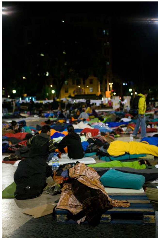
Noche del 19 de mayo en la plaza

Jueves, 19 de Mayo: 20.000 personas toman parte en la cacerolada y la asamblea, y durante el día se pasan miles de personas más, o vienen a tocar música y a hacer arte. Por la noche, algunos anarco-punks instalan una distribuidora, que sirve de punto de convergencia de varios anarquistas. Las primeras críticas originales anarquistas a la situación se imprimen y se distribuyen (ver apéndices), mientras que los textos intemporales sobre la democracia y la no violencia que acababan de ser publicados por la revista anarquista catalana, Terra Cremada 1 , se reformatean como octavillas y se distribuyen ampliamente. Por la noche, más tarde, comenzamos un debate con una crítica a la democracia. 50 personas de todo tipo participan con gran interés. Utilizamos un viejo megáfono que nos presta alguien de la CNT, pero muchos participantes prefieren no usar nada, manteniendo así pequeño el límite de participación en el debate, ya que no más de 50 personas cerca del centro pueden oír por el ruido de la plaza.