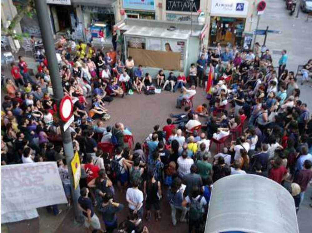
Asamblea abierta en un barrio de Barcelona, 25 de mayo

anarquistas, especialmente cuando ya habíamos estado participando en las asambleas de nuestro barrio. Era más difícil que los políticos las tomara, y mucho más difícil imponer una unidad ideológica, porque ya teníamos un punto de unidad: vivíamos en el barrio juntas, y no tenemos pretensiones de pensar todas de la misma manera.