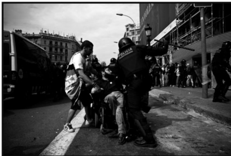
[Barcelona, 27 de Mayo 2011 ... Desalojo de la acampada popular en Plaça Catalunya]

TODO LO QUE NECESITAMOS SABER DE LA POLICÍA ES ESTO Y NADA MÁS QUE ESTO: