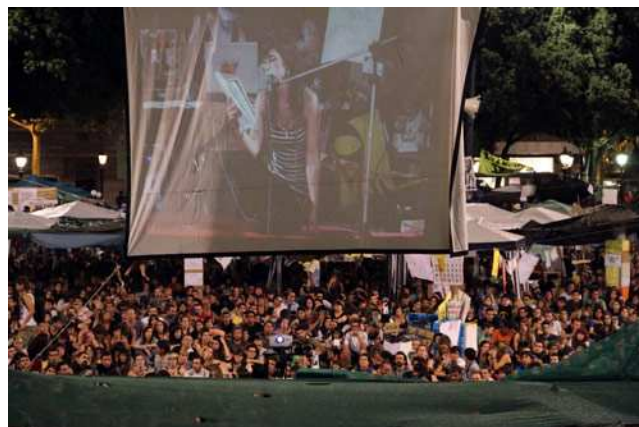
La democracia mediatizada

Recuerdo una charla en un centro social anarquista de Barcelona en la que llamamos a través de Skype a una anarquista egipcia que estaba en la Plaza Tahrir. Se rió de toda la obsesión por Twitter y Facebook, y explicó que esas herramientas son útiles, pero que su importancia había sido exagerada por los medios de comunicación occidentales.