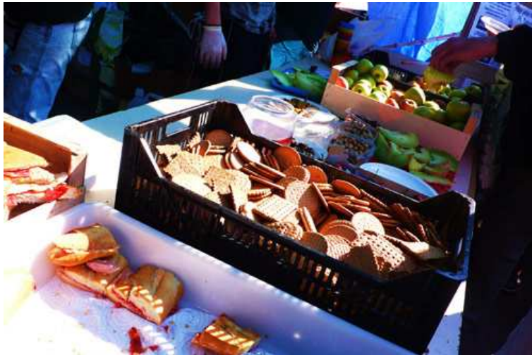
Distribución de comida

Viernes, 20 de Mayo: Anarquistas instalan una carpa por la mañana, con una mesa para distribuir flyers, carteles, y otra literatura. Ciertos participantes en la ocupación van escribiendo más críticas y se imprimen. Un auto-proclamado representante de una de las comisiones intenta echar de la plaza la carpa de los anarquistas y otra carpa instalada por miembros de un centro social okupado artístico, bajo la justificación de que el espacio de la plaza se reserva para las comisiones. La asamblea de la noche es ampliamente dominada por los trotskistas, y en menor escala, por los políticos de la izquierda independentista catalana. La multitud ha crecido más allá del límite de la plaza y ya no puede ser contada. Incluso se ha instalado un equipo de sonido de alta calidad, y aún así la mitad de la concurrencia no puede escuchar la asamblea. El número de comisiones ha llegado, según algunas cuentas, hasta 17, junto con muchas sub-comisiones. Se vuelve imposible tener una participación significativa en la estructura oficial.